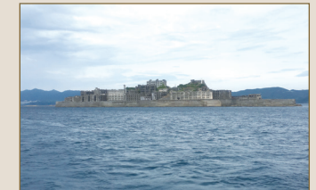
일본 나가사키의 하시마 섬(군함도)

노무동원이란 1938년 4월 일제의 국가총동원법에 의거하여 탄광, 군수공장 등 각종 산업현장으로 동원된 것을 의미합니다. 열악한 근무환경과 각종 사고로 많은 사람들이 희생되었습니다. 대표적 장소로 일본 나가사키의 하시마 섬을 비롯해 규슈, 홋카이도, 야마구치 지역의 여러 탄광이 있습니다