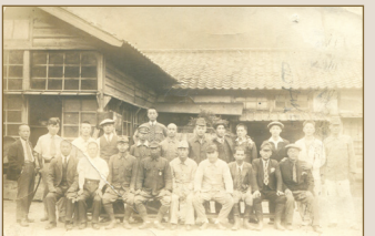
홋카이도 이쿠노(生野)광업소로 동원된 노무자들