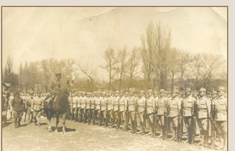
평양 제2육군병지원자 훈련소 입소식