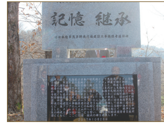
일본 홋카이도 슈마리나이(2017)