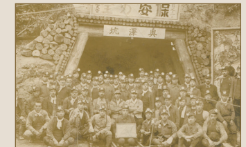
홋카이도 사쿠베츠(尺別)탄광으로 동원된 노무자들