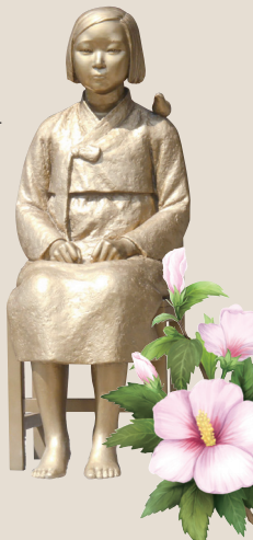
일본대사관 앞 소녀상

여자근로정신대는 일본의 전쟁을 지원한다는 명분으로 세워진 조직으로 '여자정신근로령'을 근거로 전쟁을 위한 노역에 투입되었으며, 감당하기 어려운 고된 중노동을 강요받았습니다.