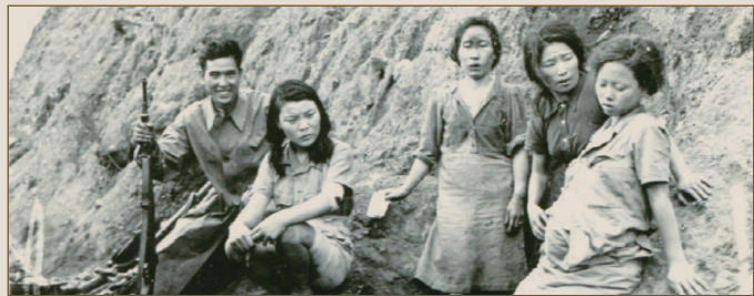
미국 국립기록관리청 소장 일본군'위안부'사진(RG111SC-230147)