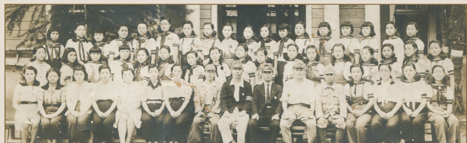
여자근로정신대로 동원된 여성들