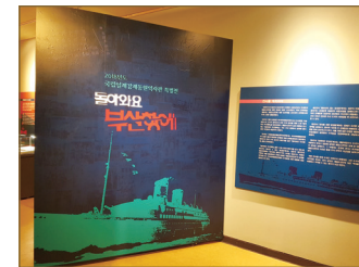
역사관 특별전 「돌아와요 부산항에」